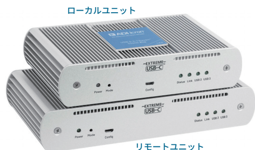
ローカルユニット

USB 3-2-1 を1本のCAT 6A/7 ケーブルで100m、または10G LAN スイッチ経由で最大200m延長!